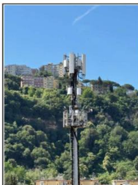
Figura 3 – Foto Sorgenti RF “Apparati e/o Impianti di Radio Telecomunicazioni”